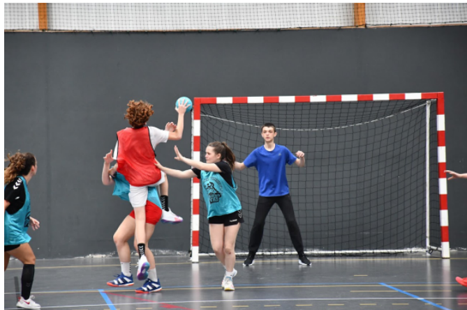
Les séances entraînements HANDBALL