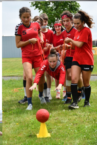
Séances loisir, jeux, déguisement, piscine, rigolades